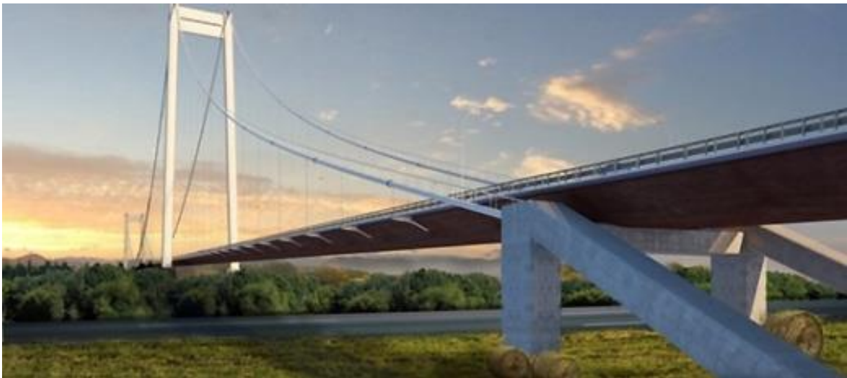
Cầu Braila, Rumani (đang thi công)