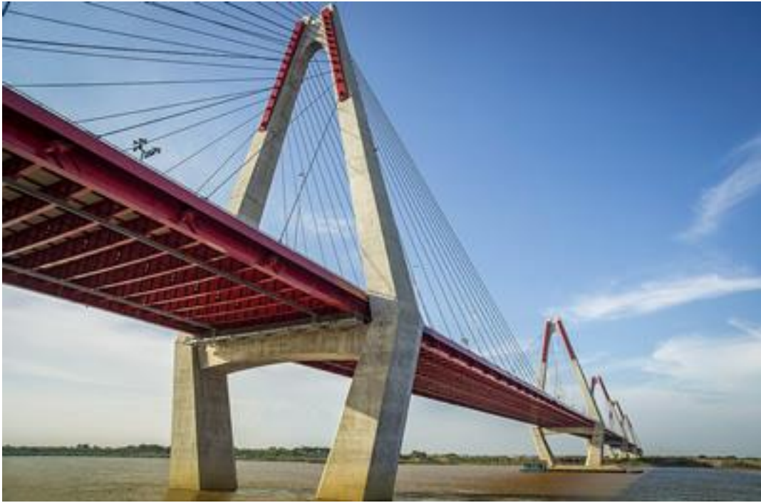
Cầu Nhật Tân, Hà Nội