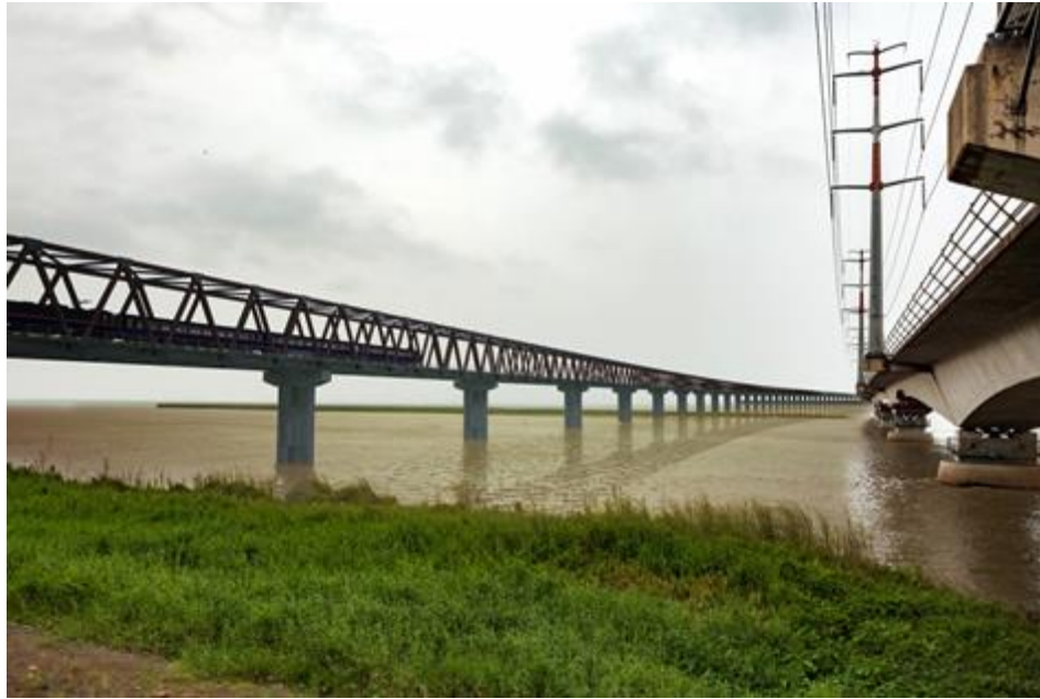
Cầu đường sắt Bangabandhu Sheikh Mujib, Bangladesh (đang thi công)